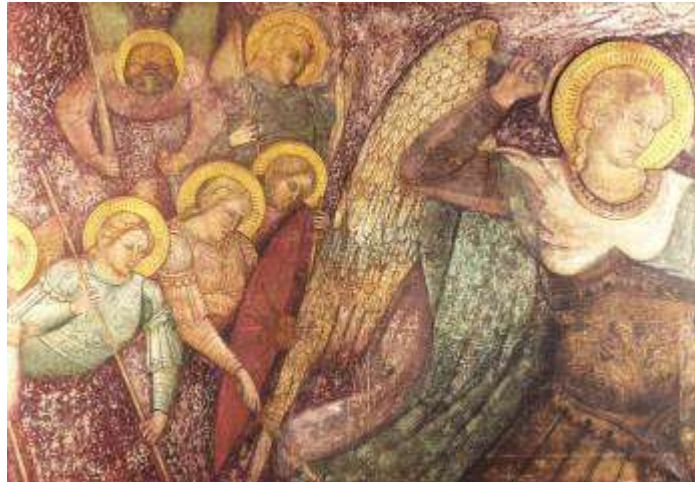
San Michele e gli angeli

2.000 anni fa, Gesù è stato perseguitato e ammazzato. Il dragone continua a fare la lotta contro chi ha la testimonianza di Gesù.